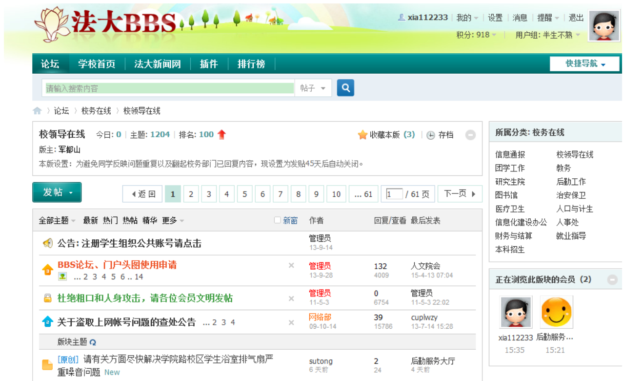
图 1：中国政法大学 BBS 校务在线版块