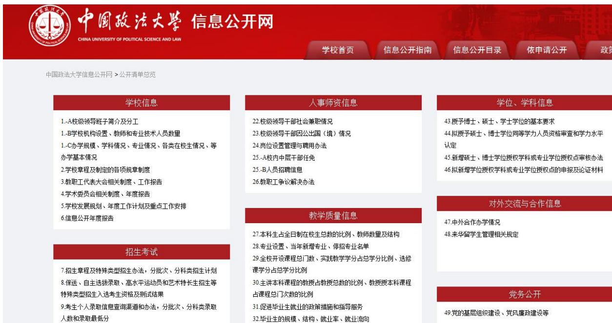
图 2：中国政法大学公开清单总览

并茂的形式，将关键信息转化为生动的图片进行解读，提高了学校信息的可读性；增加“网上信访”和“网上投诉”功能，实现在线投诉和解答。