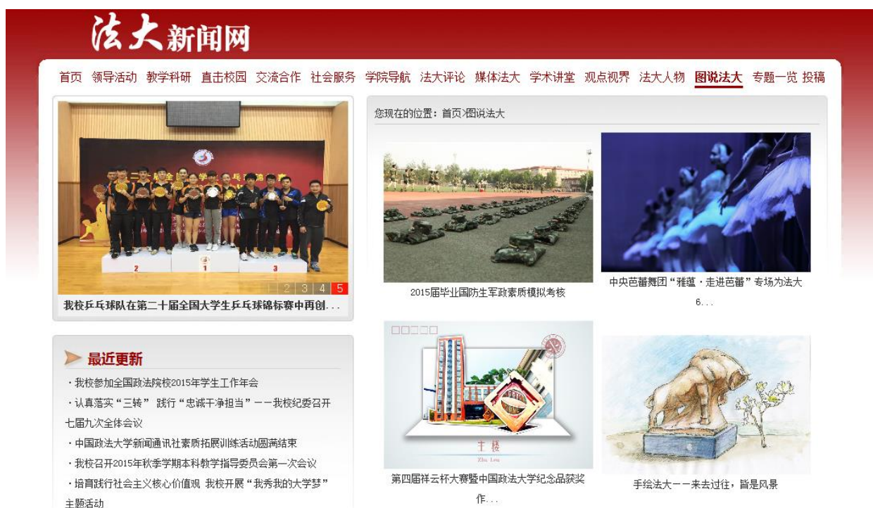
图3: 中国政法大学图说法大图集

截至2015年8月31日,学校主动公开各类信息共12659条。其中,信息公开专栏公开学校信息516条;校园办公系统新增信息199条;校园网主页发布通知公告1722条、各类新闻信息1643条;通过各二级单位网站发布信息7016(包括本科招生信息40条、研究生招生信息70条);共发布学校手机报56期;微信图文推送394次(共1182条图文信息),语音推送1次;共发布1040条微博,累计转发840次;制作法大人物专题31期、图说法大图集31期、8个专题网站和2期网上展厅。