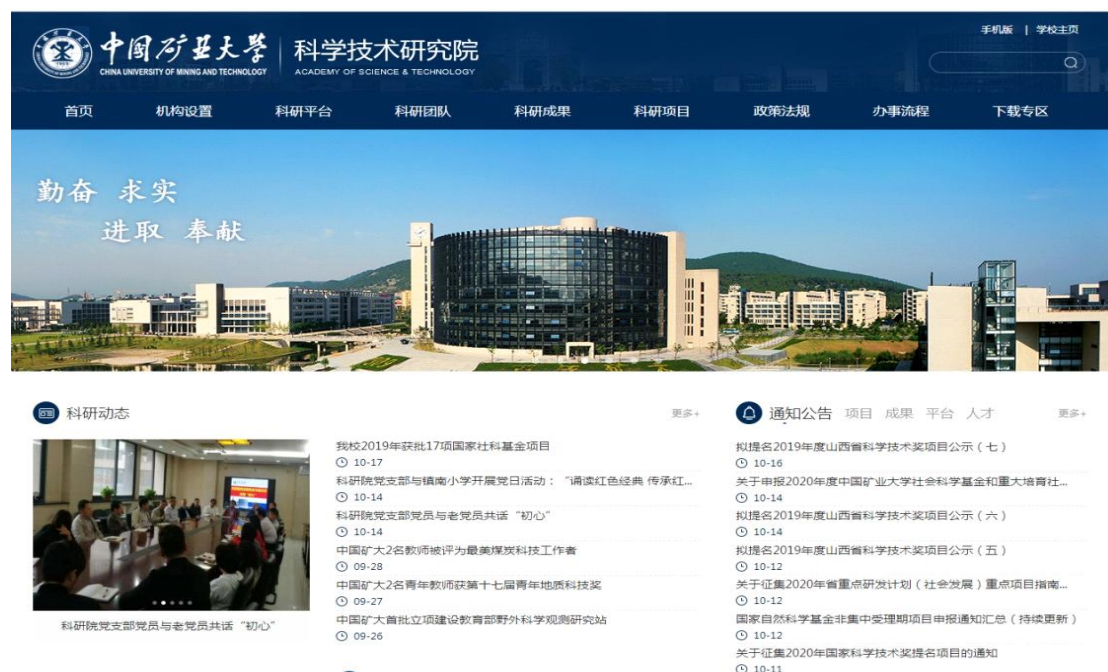
图 11 中国矿业大学科研院网站

费管理办法》《横向科研项目与经费管理办法》《科研经费采购实施细则》等文件，明确项目经费管理和使用规范；召开科研经费政策宣讲会，做好宣传和警示教育。二是科技奖励、项目、基金、平台申报公开。通过网站、微信订阅号、微信群、短信等方式向全校发出申报通知，科研院进行资格审查，限项申报的提交校学术委员会进行审议、投票确定推荐项目，公示无异议后予以上报。三是科研绩效、知识产权资助与高水平成果奖励发放严格按照学校文件执行，由科研院统计、汇总、审核后，在学校科研院网站或校内行健楼前公示且无异议后面向教师发放。四是各类团队、优秀人才的评选与推荐公开。省部科技创新团队、各级各类青年科技奖、各级科技人才等坚持择优推荐原则，在全校范围公开评选、推荐通知，教师自愿报名，科研院审查通过后提交校学术委员会进行审议、投票确定候选团队或候选人，公示无异议后上报评选单位。