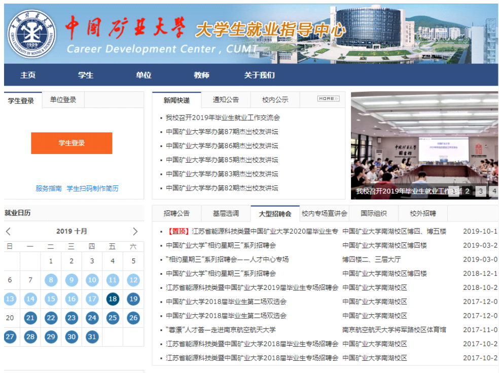
图 5 中国矿业大学大学生就业指导中心网站

走访全国 30 个城市 114 家企事业单位。建立“互联网+就业”智慧就业线上线下“双平台”，提升就业服务精准度。全年自媒体平台推送各类信息 1500 多条，粉丝量达到 3.5 万。2018 届毕业生年终就业率保持在 98% 以上。学校获评“2018 年高校毕业生就业创业工作考核优秀单位”称号。