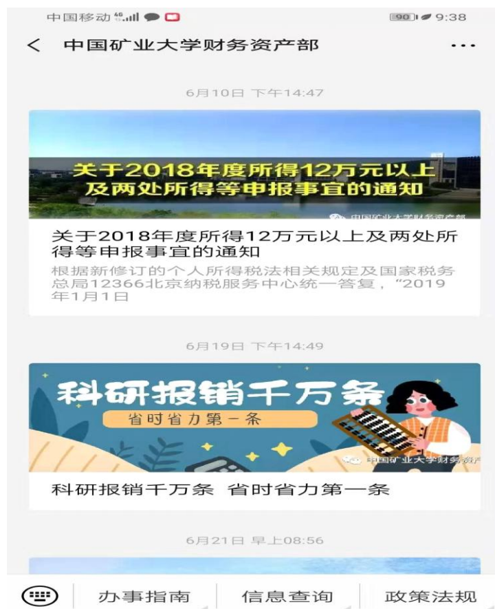
图 7 中国矿业大学财务部微信公众号推送的信息

——严格贯彻教育部、财政部等关于财务信息公开政策，推行财务公开，让财务在阳光下运行。