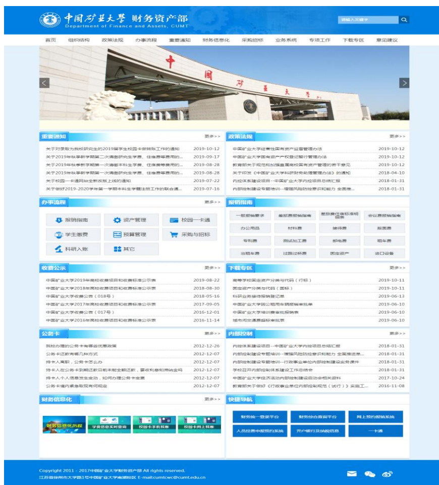
图 2 中国矿业大学财务资产部网站

程序公开、评审结果公开，真正地让广大教职工感到“公平、公正、公开”。针对校园基本建设、大宗物资采购、招生工作等廉政重点领域，构建了廉政风险防控体系。加强对财务预算和决算信息的公开，特别是结合校院两级财务管理体制改革对财务预算执行情况及重大财务开支进行通报。常年在信息公开栏公开当年的教育收费项目、收费标准、收费依据、财务处收费咨询热线以及投诉方式等信息，确保学生及其家长等利益相关者能够了解学校收费情况。