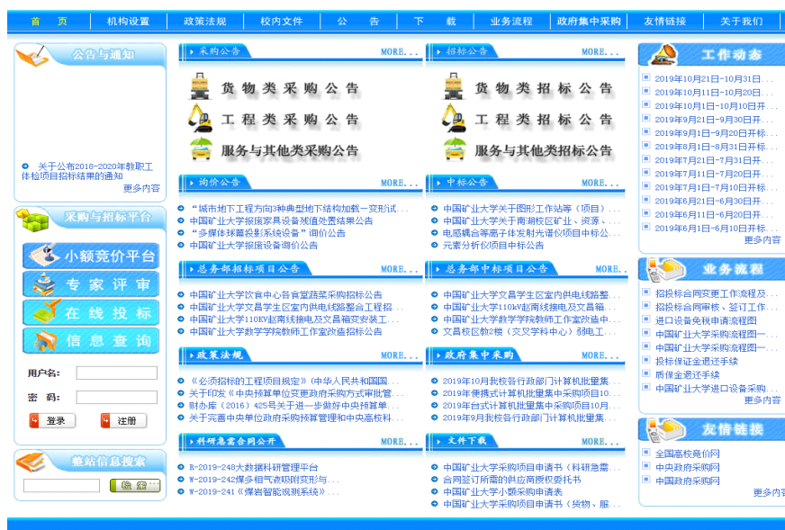
图 8 中国矿业大学招标与采购网站

按规定在中国矿业大学信息公开网、中国矿业大学采购与招标网、全国高校竞价网、徐州市公共资源交易网、江苏建设工程招标网、中国采购与招标网、中国招标投标公共服务平台及中国政府采购网发布采购项目信息。政府采购预算限额以上政府采购项目，除在校内信息公开平台发布外，还在指定媒体（包括中国政府采购网、江苏建设工程招标网、徐州市公共资源交易网、中国采购与招标网、中国招标投标公共服务平台）同步发布采购项目信息。一年来，共发布采购项目信息 1915 条公告（采购公告 1063 条，结果公告 852 条），其中在国家级门户网站发布 111 条，学校网站发布 1615 条，其他社会公开网站发布 189 条。