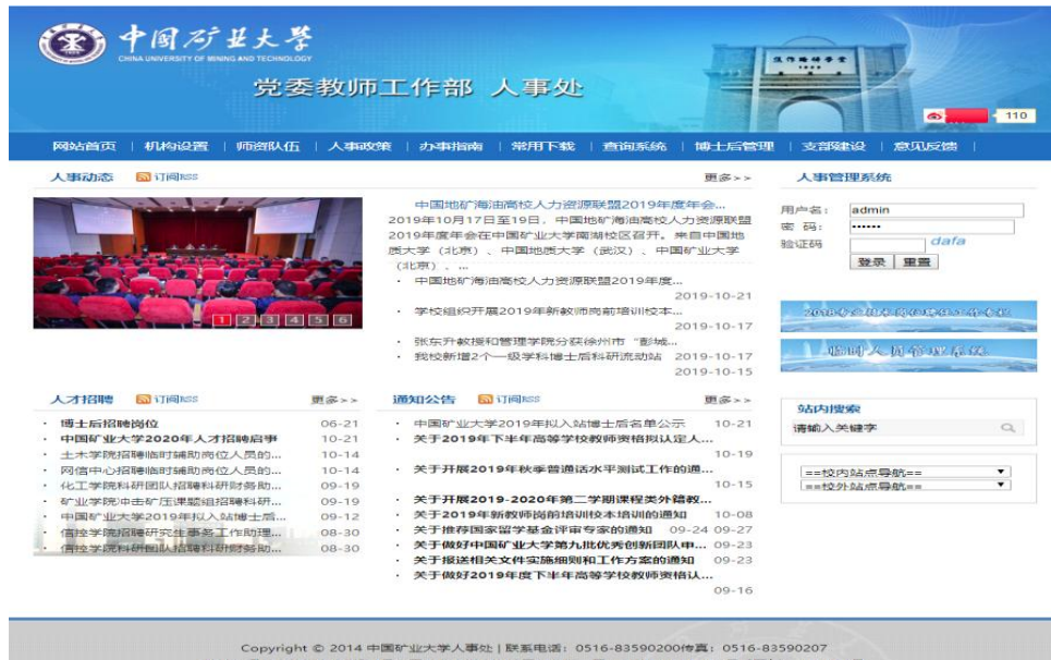
图 13 中国矿业大学人事处网站

本学年度，通过学校信息公开网、矿大校园网、人事处、人才工作办公室网站等服务平台发布招聘、录用等信息，严格选人用人程序，提高工作透明度。