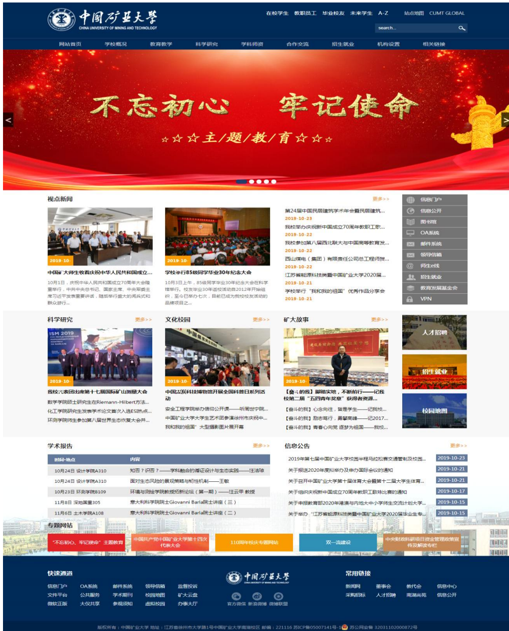
图 1 中国矿业大学校园网主页

服务，不断畅通信息公开渠道。着力打造“智慧矿大校园”，制定学校信息化规划，将信息公开列为重要内容，进一步优化和改进校园网主页，通过现代信息技术为广大师生和社会公众浏览查看提供更加便捷舒适的服务。