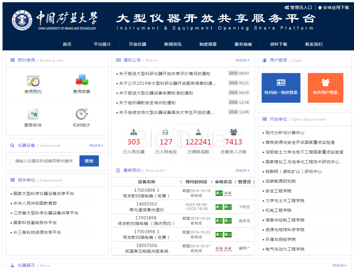
图 10 中国矿业大学大型仪器设备开放共享服务平台