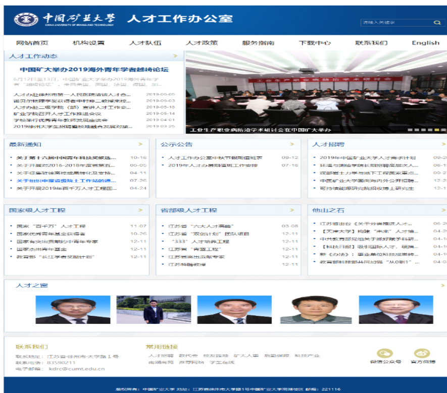
图 14 中国矿业大学人才工作办公室网站