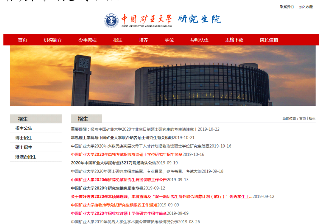
图 6 中国矿业大学研究生招生网站

——招生信息公开畅通，拓宽招生宣传媒体渠道。利用微信公众号“中国矿业大学研究生院”进行招生政策、报考指南、学科前沿等方面宣传。积极拓展教育媒体宣传平台，与中国考研招生网、360 教育在线合作，推出“中国矿业大学研究生招生专题”，参加“2020 年全国研招院校面对面”活动，全面介绍我校各相关二级学院、学科专业、导师科研、研究生就业等情况。积极参与中国研究生招生信息网等网络媒体组织的在线访谈和在线咨询活动。