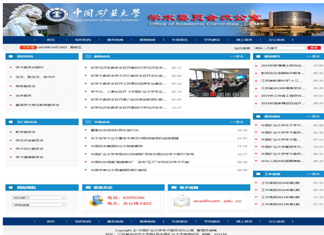
图 12 中国矿业大学学术委员会办公室网站

坚持学术至上，教授治学。校学术委员会召开各类评审、咨询会议 41 次，审议议题 68 项，咨询议题 7 项。通过各类会议纪要、通讯报道、公告与公示等渠道，面向全校师生员工和社会各界及时主动发布重大、重要学术评审和咨询信息等 54 条。重大学术事务，校学术委员会还邀请教代会学术评议监督工作委员会委员、校纪委列席校学术委员会及各专门委员会会议，保证各类学术评审的公开性。校学术委员会办公室专门负责受理日常举报；各类评审结果的公示，均公布了校学术委员会办公室和议题提交部门的举报、投诉和申诉的电话、电子信箱和通讯地址等信息，接受全校师生和社会各界的举报、投诉和监督。编制了《中国矿业大学学术年度报告（2017-2018）》，提交教代会审议通过。认真贯彻落实中办、国办和教育部关于学风建设的有关精神，受理学术不端行为案件 1 件，按程序开展了调查处理。