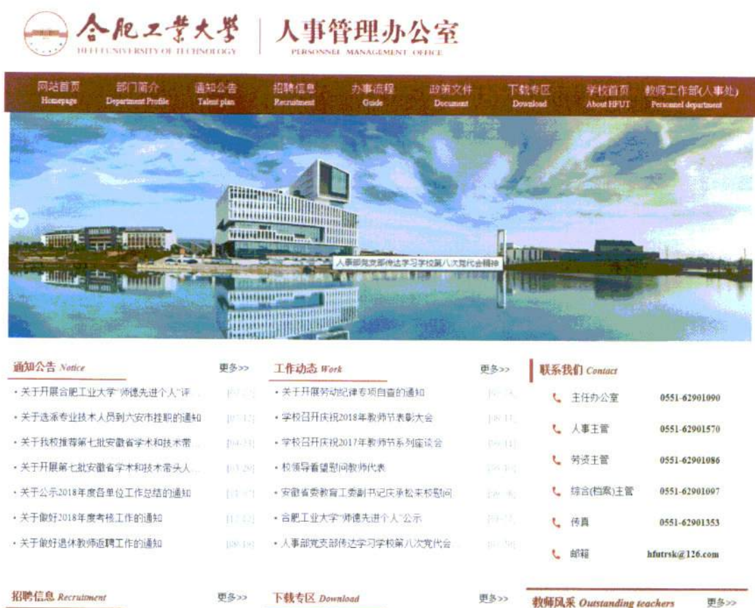
图 8: 学校人事师资信息公开情况

员管理办法》，致力于培养高层次创新型青年人才，提升学科建设水平。学校中层干部任免调整，按程序公布相关信息，发布任前公示。公开招聘人员公示情况也在人事部网站予以公开。