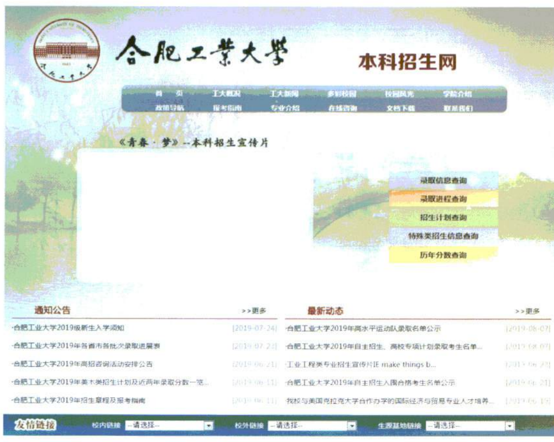
图 5: 合肥工业大学本科生招生网站

拟定各专业研究生招生计划，发布招生简章，及时更新教育部关于全国硕士研究生招生工作管理规定的通知，制定合肥工业大学研究生招生复试实施办法和硕博连读生遴选实施办法，对考试内容、考试方式、报考点情况进行网上公示，并设有咨询热线，由专业分管老师负责解答。对研究生报名、资格审查、录取结果公示、考生调剂等流程严格把关，并及时公布招生计划的动态变化，做到招生录取信息全面公开。