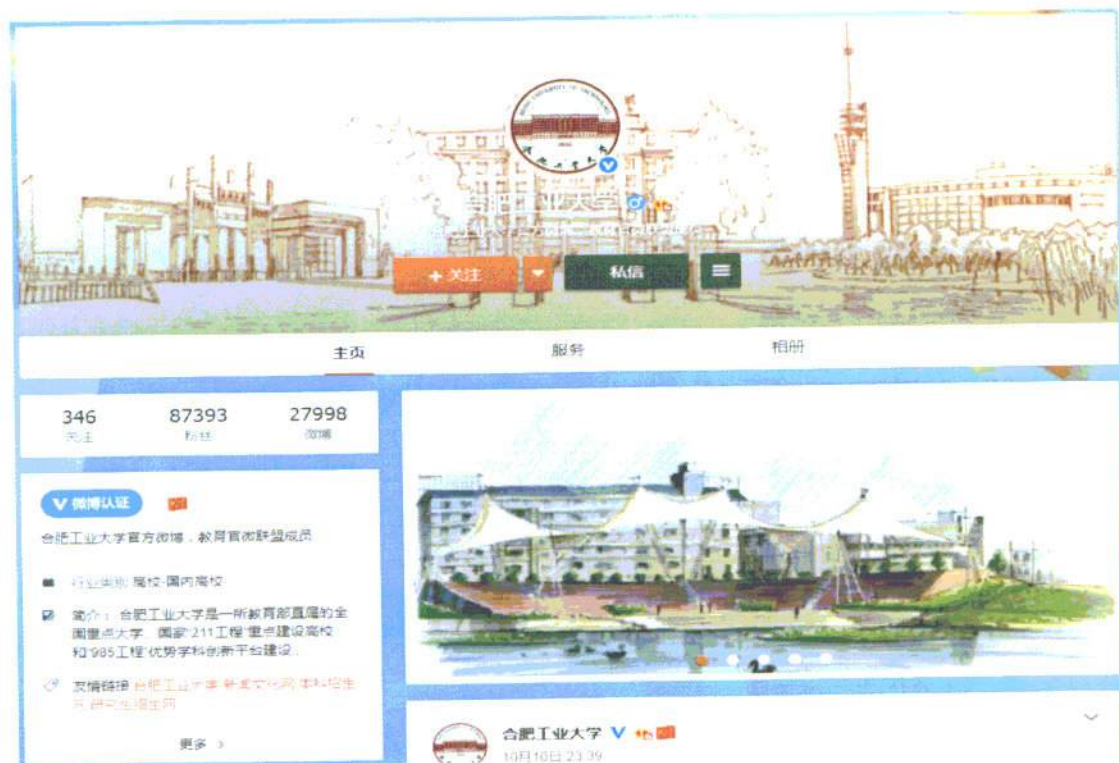
图 1: 学校官方微博页面

学校信息公开网包括信息公开指南、信息公开目录、规章制度、依申请公开、受理与监督、信息查询等多个栏目。通过网站内容和相关链接，学校师生和社会公众可以对学校信息公开的制度及内容进行高效和便捷的查阅查询。为适应现代科技的快速发展和扩展师生员工、社会公众获取消息的渠道，学校构建了以学校主页为基础，新闻文化网为主要载体，结合微博、微信等新媒体的全新综合信息发布渠道，推动信息公开工作深入开展。