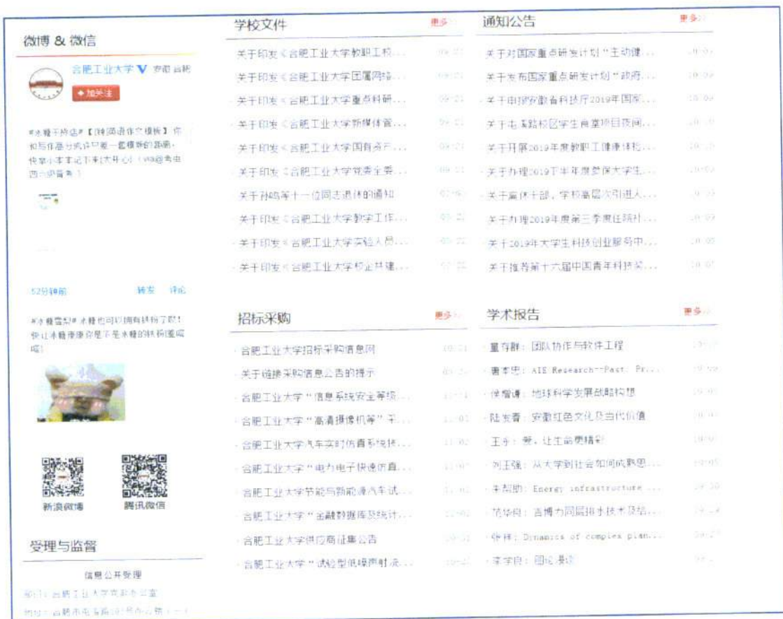
图 2: 学校信息公开网主页