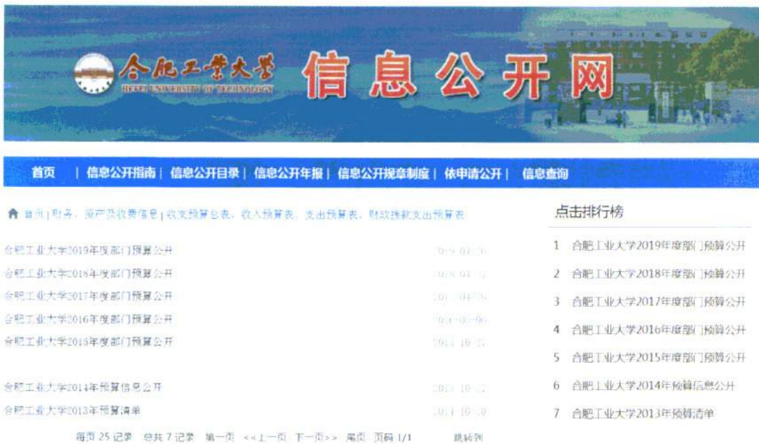
图 7：学校年度部门预算公开情况

教代会上，由分管财务部门的校领导向大会汇报当年学校的财务收支状况；通过校情通报会、校财经工作领导小组会等形式，通报财务运行状况和各单位预算执行情况。在教育部预算、决算批复后 10 个工作日内，通过学校信息公开网及时主动地向社会主动公开高等学校收支预算总表、高等学校收入预算表、高等学校支出预算表、高等学校财政拨款支出预算表、高等学校收支决算总表、高等学校收入决算表、高等学校支出决算表、高等学校财政拨款支出决算表等财务信息。