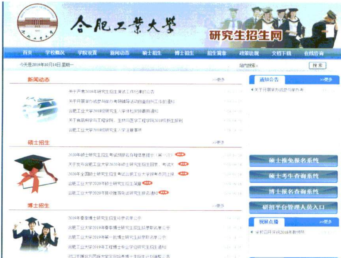
图 6: 合肥工业大学研究生招生网站