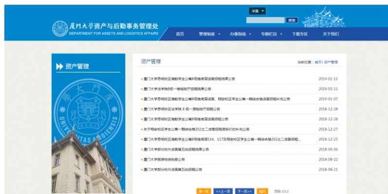
▲ 资产管理信息公开页面