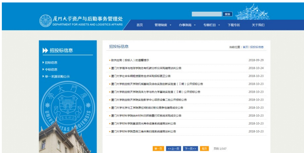
▲ 招投标信息公开页面

学校资产与后勤事务管理处网站 ( http://zchqc.xmu.edu.cn/ ) 专门开辟“招投标信息” ( http://zchqc.xmu.edu.cn/14339/list.htm )、“资产管理”专栏 ( http://zchqc.xmu.edu.cn/14348/list.htm )。“招投标信息栏”对学校集中采购限额标准以上的货物、服务、修缮工程采购依法依规进行公示公告，“资产管理栏”以公开公告方式出租店面、拍卖报废物资等。本学年度共公开各类信息 1263 条。