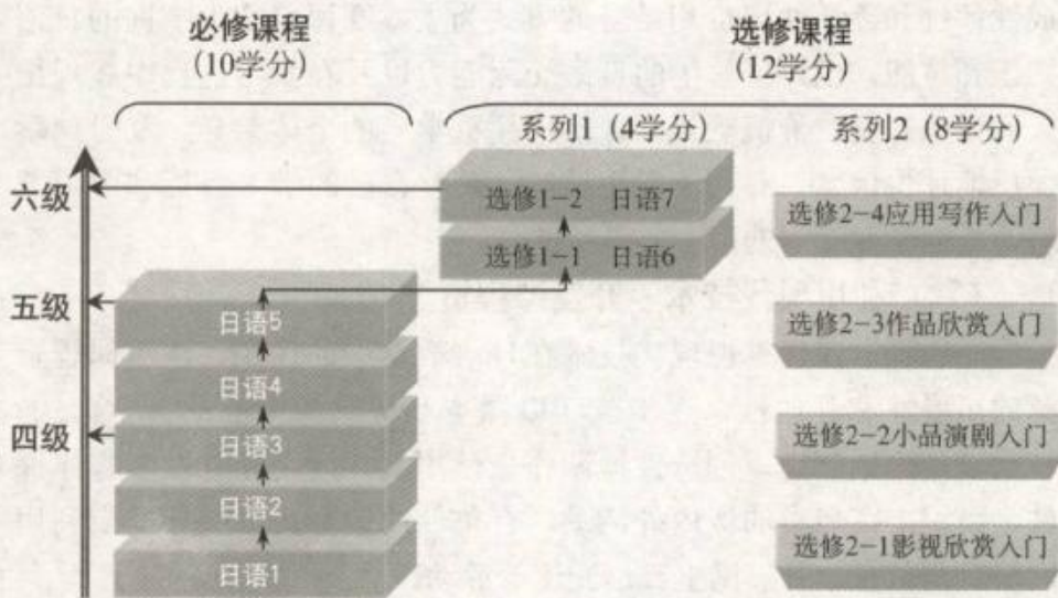
高中日语课程结构图示

高中日语课程分为“必修课程”和“选修课程”，包括 11 个学习模块，各学习模块的学分和学时相等，均为 2 学分，36 学时。如下图所示。