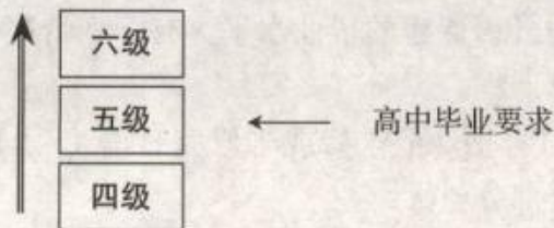
图1 高中日语课程目标分级图示

根据《国家基础教育课程改革纲要（试行）》，参照国际、国内外语教育改革、发展的成果，结合高中生身心发展的特点，高中阶段的日语课程目标定为“培养学生基本的综合语言运用能力”。日语课程目标的整体框架和分级设计的方式与义务教育阶段相同。分级设计如图1所示。